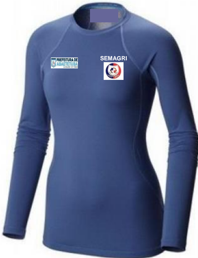
Imagem - item 21. Camisa Térmica Feminina - Blusa Proteção UV 50 Quente/Frio Fitness: