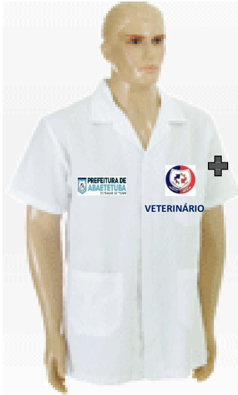
Imagem - Item 10. Jaleco Visitante: