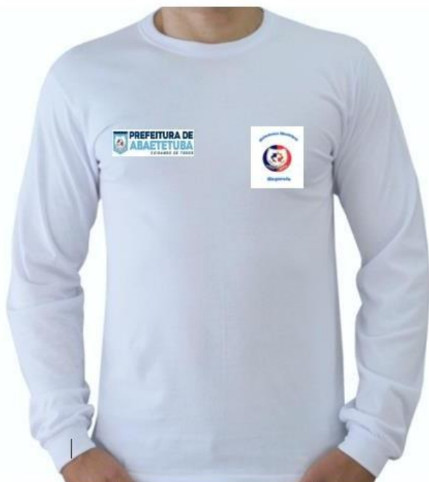
Imagem - Itens 01. Camisa branca