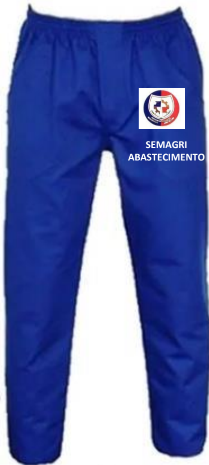
Imagem - Item 08: Jaleco de Inspeção: