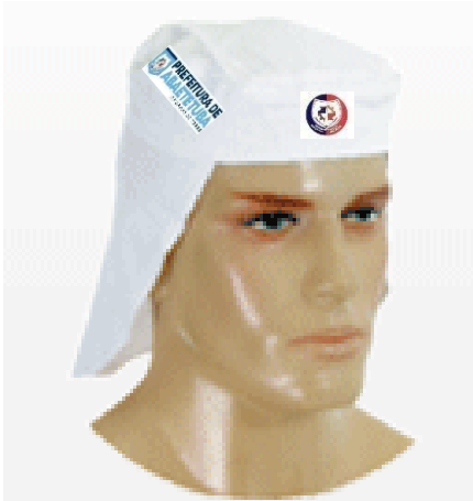
Imagem - Item 12. Boné, modelo "basebol"