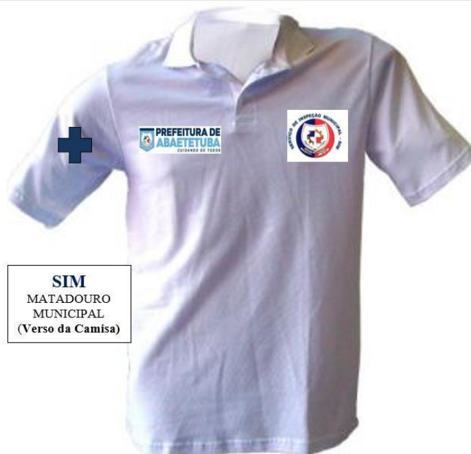
Imagem - Item 02. Camisa branca – Inspeção:

SIM MATADOURO MUNICIPAL (Verso da Camisa)