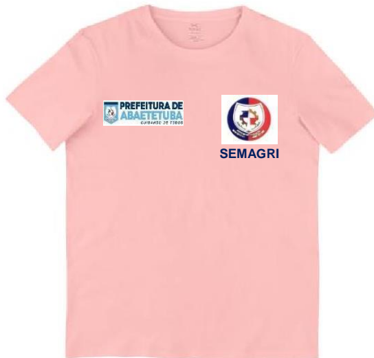
Imagem - item 20. Camisa Térmica Masculina adulto - Blusa Proteção UV 50 Quente/Frio Fitness:

Imagem - item 19. Camiseta manga curta - Uniforme e Eventos: