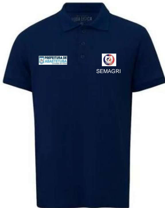
Imagem - item 14. Camisa Uniforme Masculino, mangas compridas, estilo social: