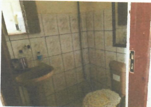
Imagem 5-Banheiro da secretaria