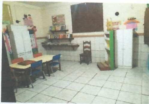
Imagem 17-Sala de aula no térreo