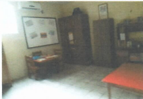
Imagem 11-Sala de aula