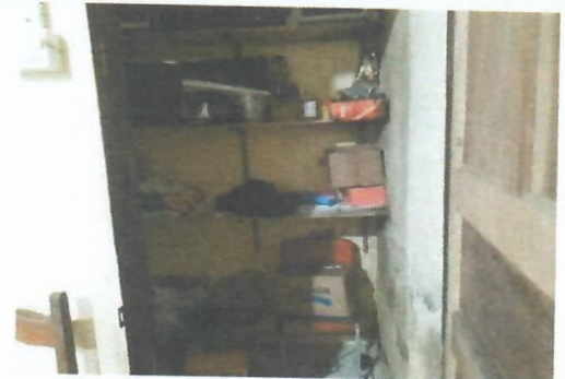
Imagem 4-Depósito da secretaria