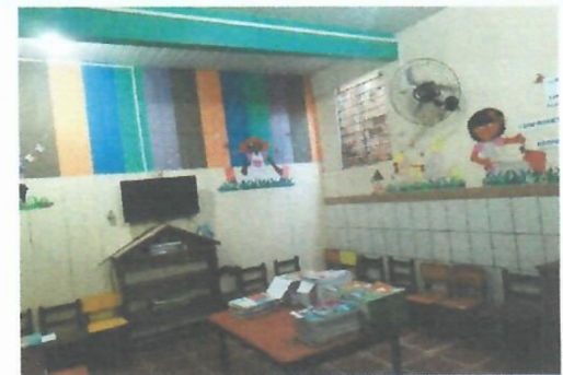
Imagem 16-Sala de aula no térreo