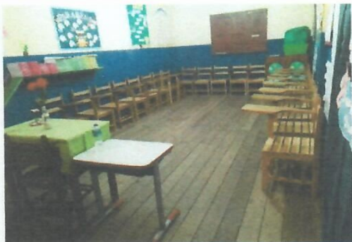
Imagem 25-Sala de pav. superior (em assoalho)