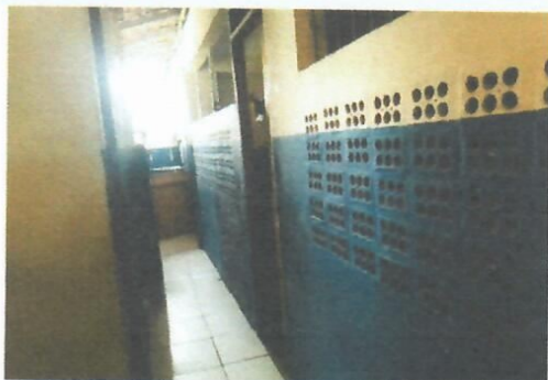
Imagem 23-Corredor de acesso a uma das salas no térreo