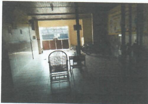
Imagem 7- Pátio da entrada