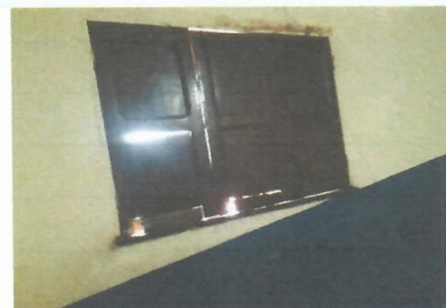
Imagem 28-Janela de madeira deteriorada