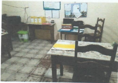
Imagem 3 - Secretaria (com piso já desgastado)