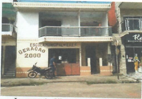
Imagem 1 - Vista Frontal (Escola)