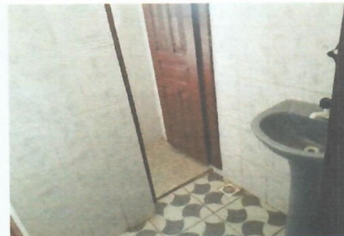
Imagem 30-Banheiro do pav. superior