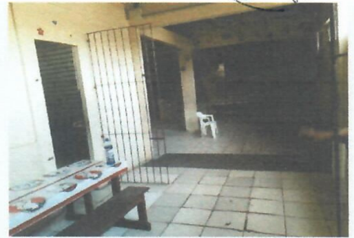
Imagem 10-Entrada da área de refeição