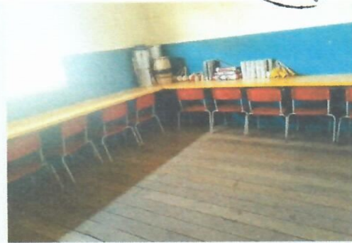
Imagem 26-Sala de aula pav. superior