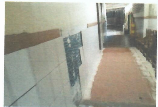
Imagem 8-Corredor de acesso para a área pedagógica (com azulejo da parede deslocando e piso antigo)