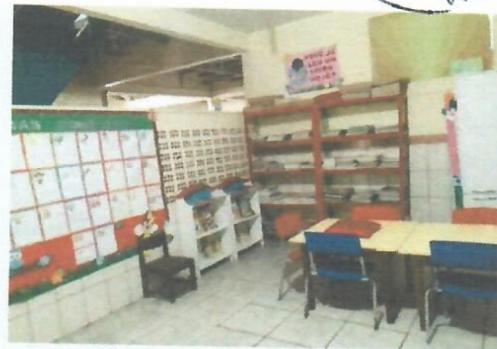
Imagem 18- Sala de aula no térreo