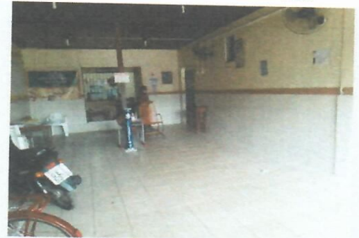
Imagem 2 - Área de entrada da escola