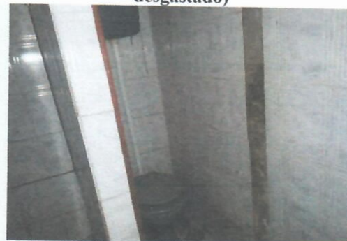
Imagem 22-Banheiro do térreo com caixa de descarga