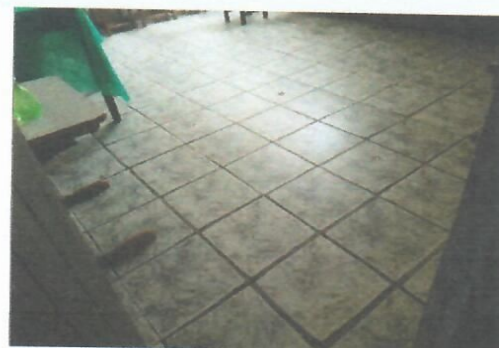
Imagem 20- Sala de aula no térreo (com piso antigo e desgastado)