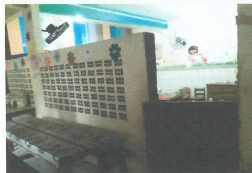
Imagem 15-Sala de aula pavimento térreo (padrão inadequado com pouca iluminação natural)