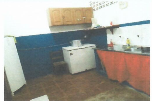
Imagem 12-Cozinha (piso já bastante desgastado)