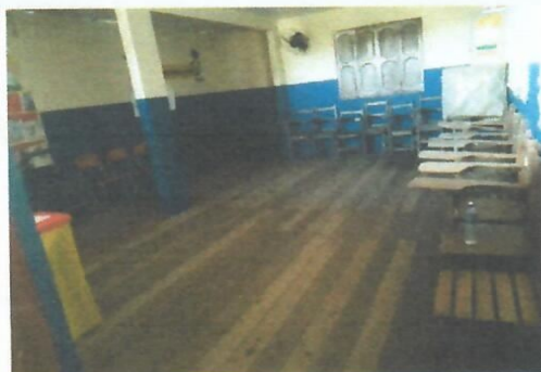
Imagem 31-Sala de aula piso em madeira e carteiras antigas