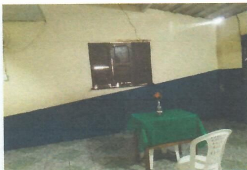
Imagem 29-Sala no pav. superior