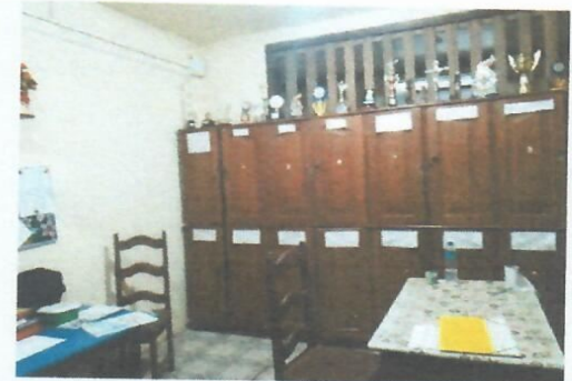
Imagem 6 - Secretaria