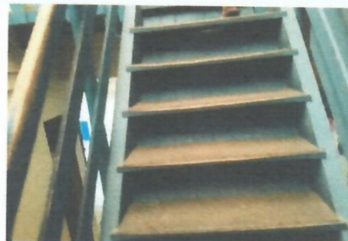
Imagem 24-Escada de madeira de acesso ao pav. superior