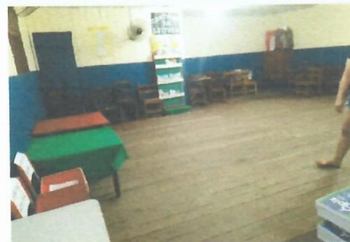
Imagem 32-Sala de aula pav. superior (pouca iluminação natural)