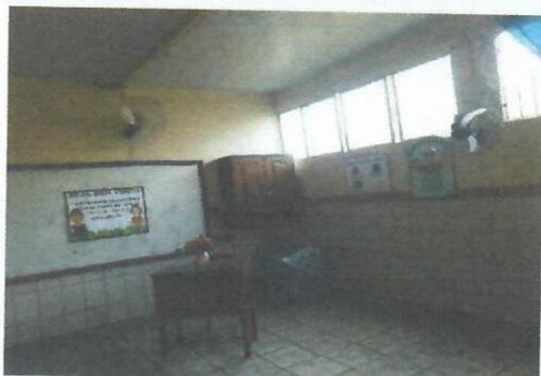
Imagem 19-Sala de aula (com melhor iluminação)