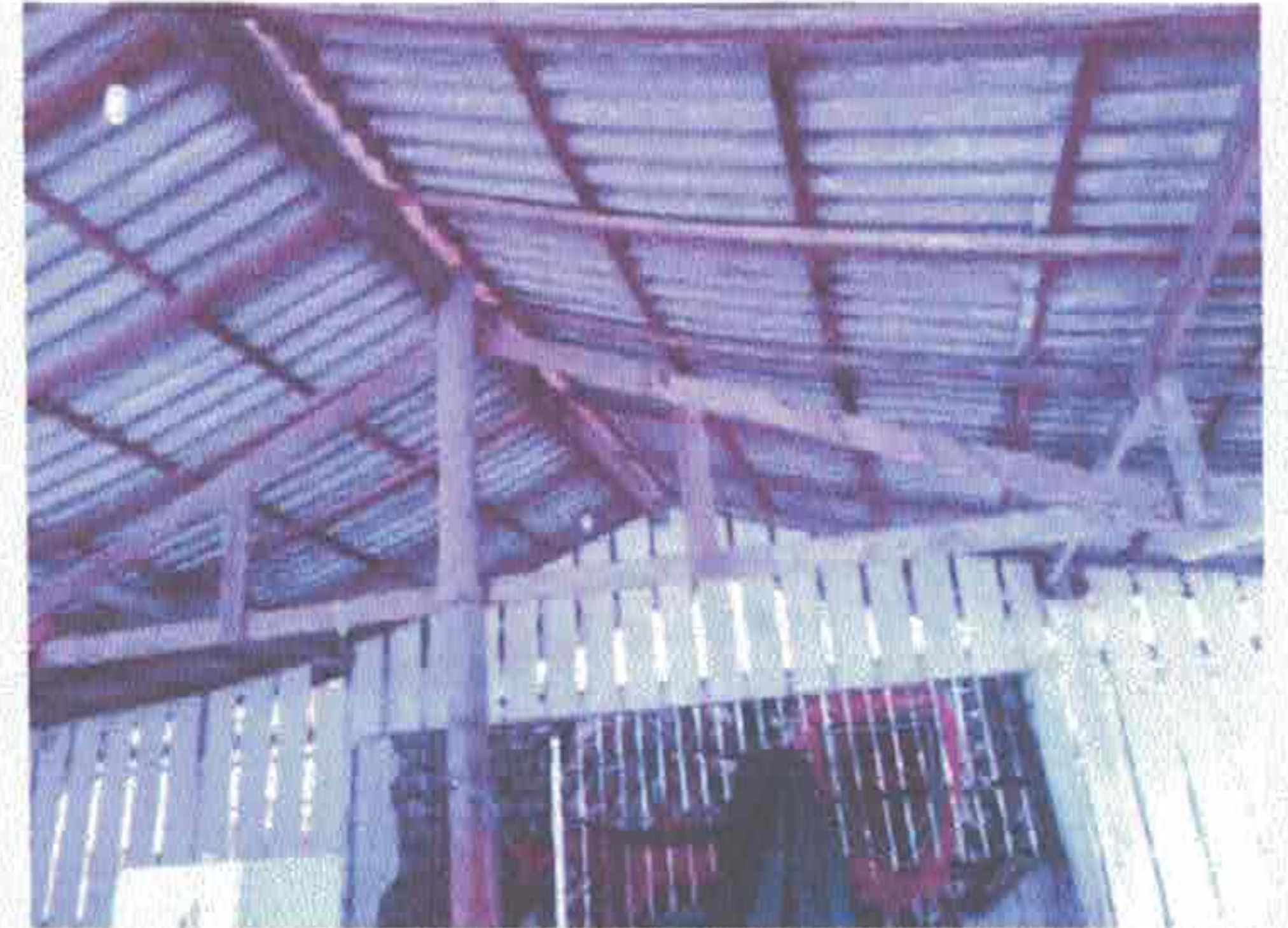
Imagem 4-Telha de fibrocimento