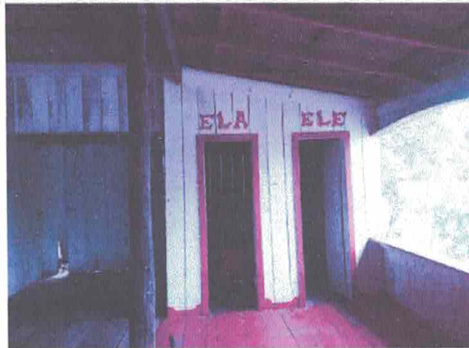
Imagem 5-Banheiros que precisam passar por adequação