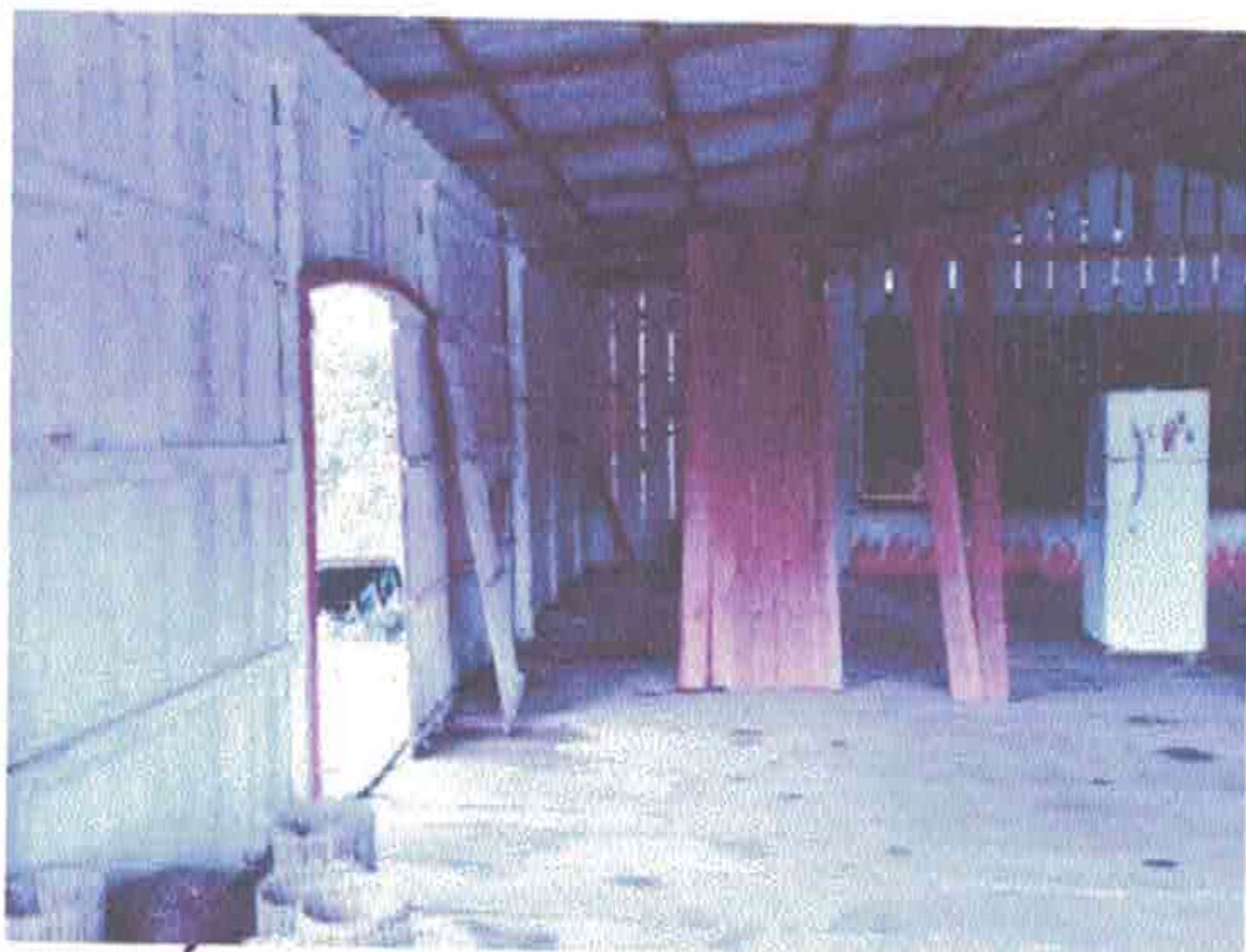
Imagem 9- Área do salão que pode ser dividida em sala