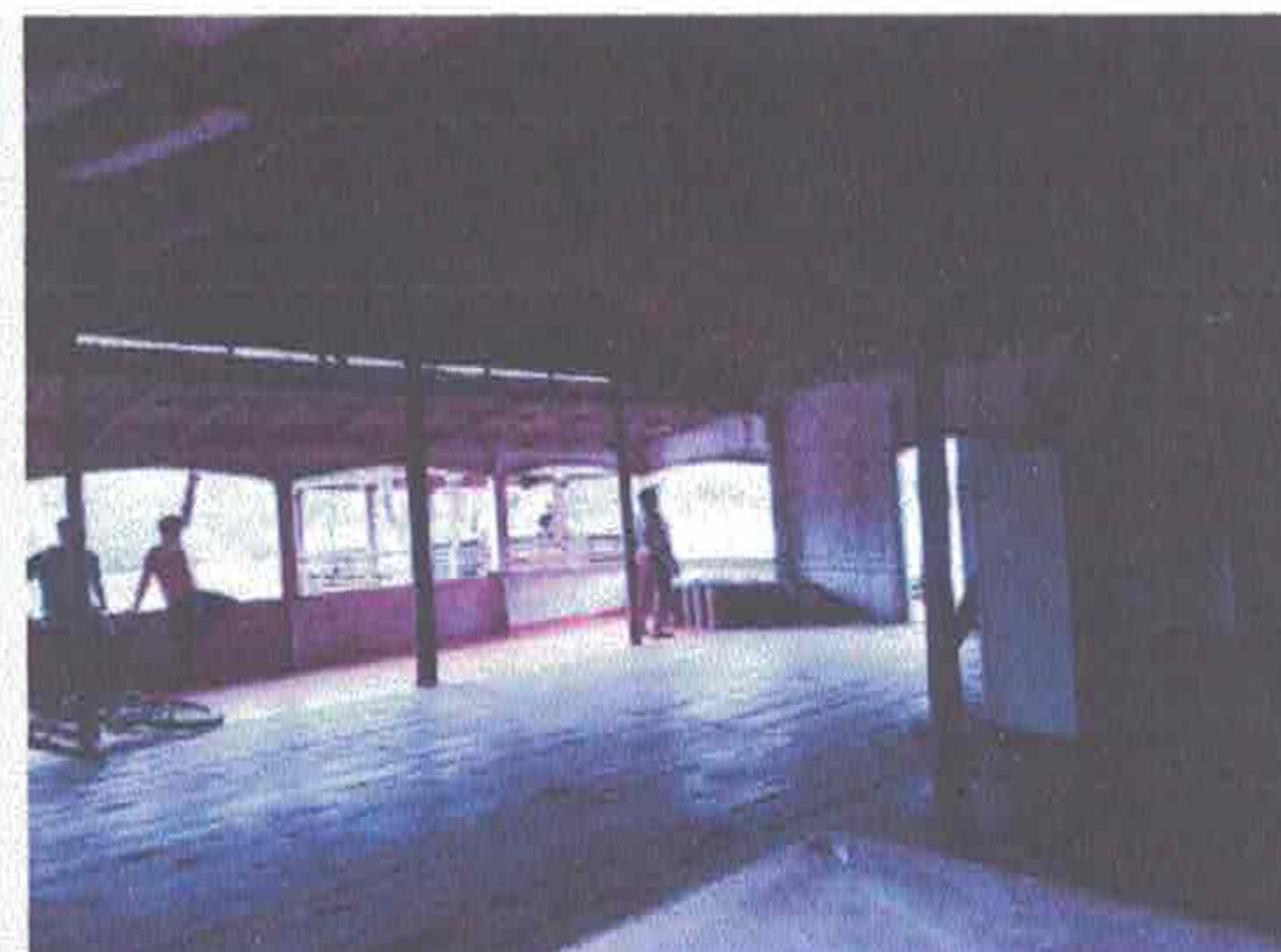
Imagem 7- Área do salão que pode ser dividida em sala