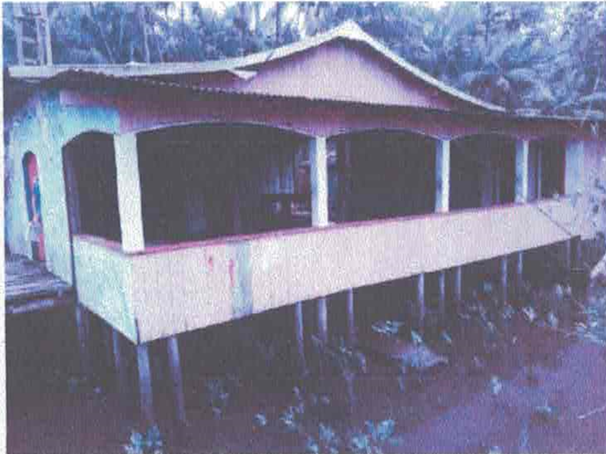
Imagem 3 – Vista de frente p/ o rio