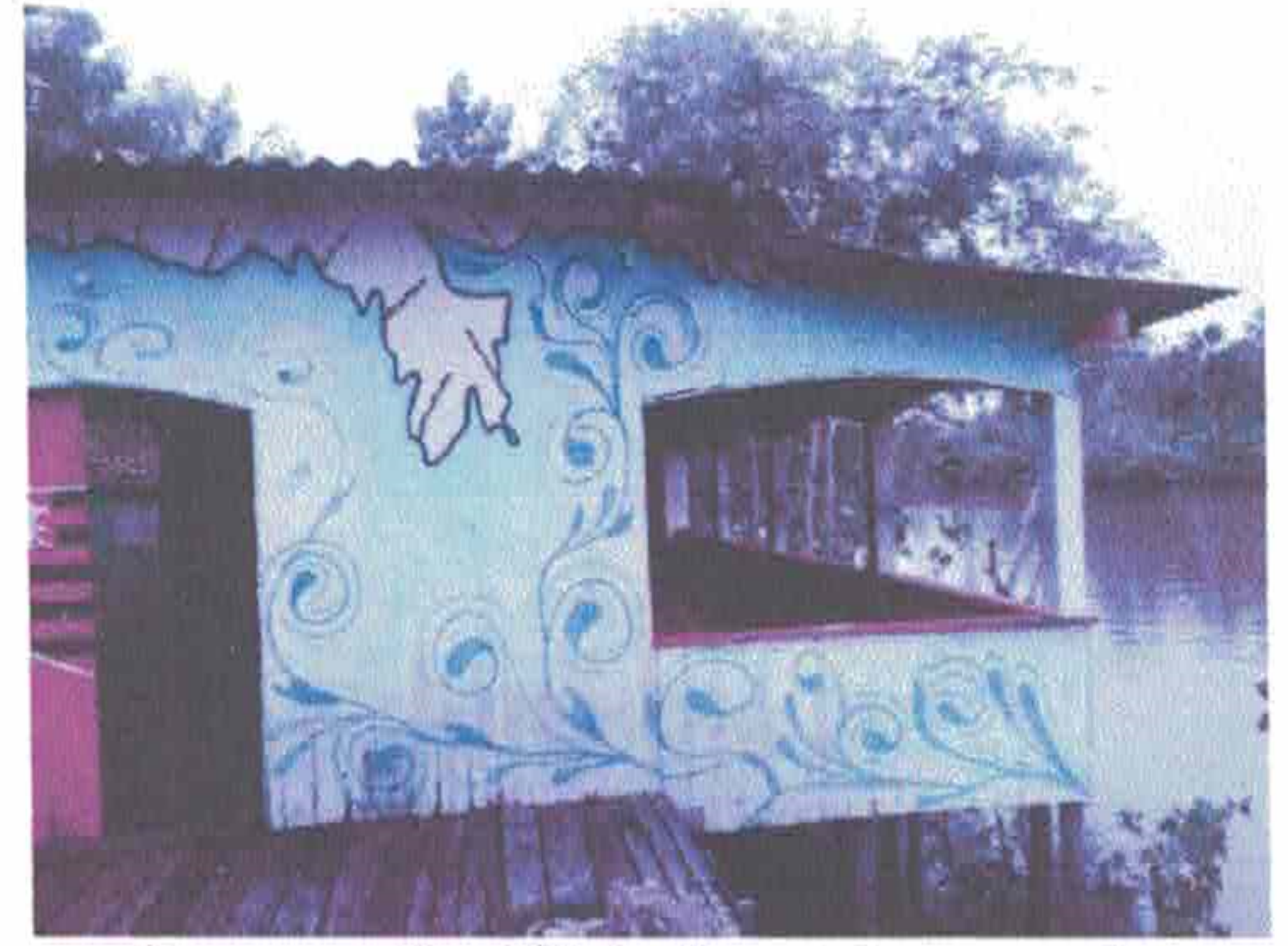
Imagem 2 – Vista frontal esquerda