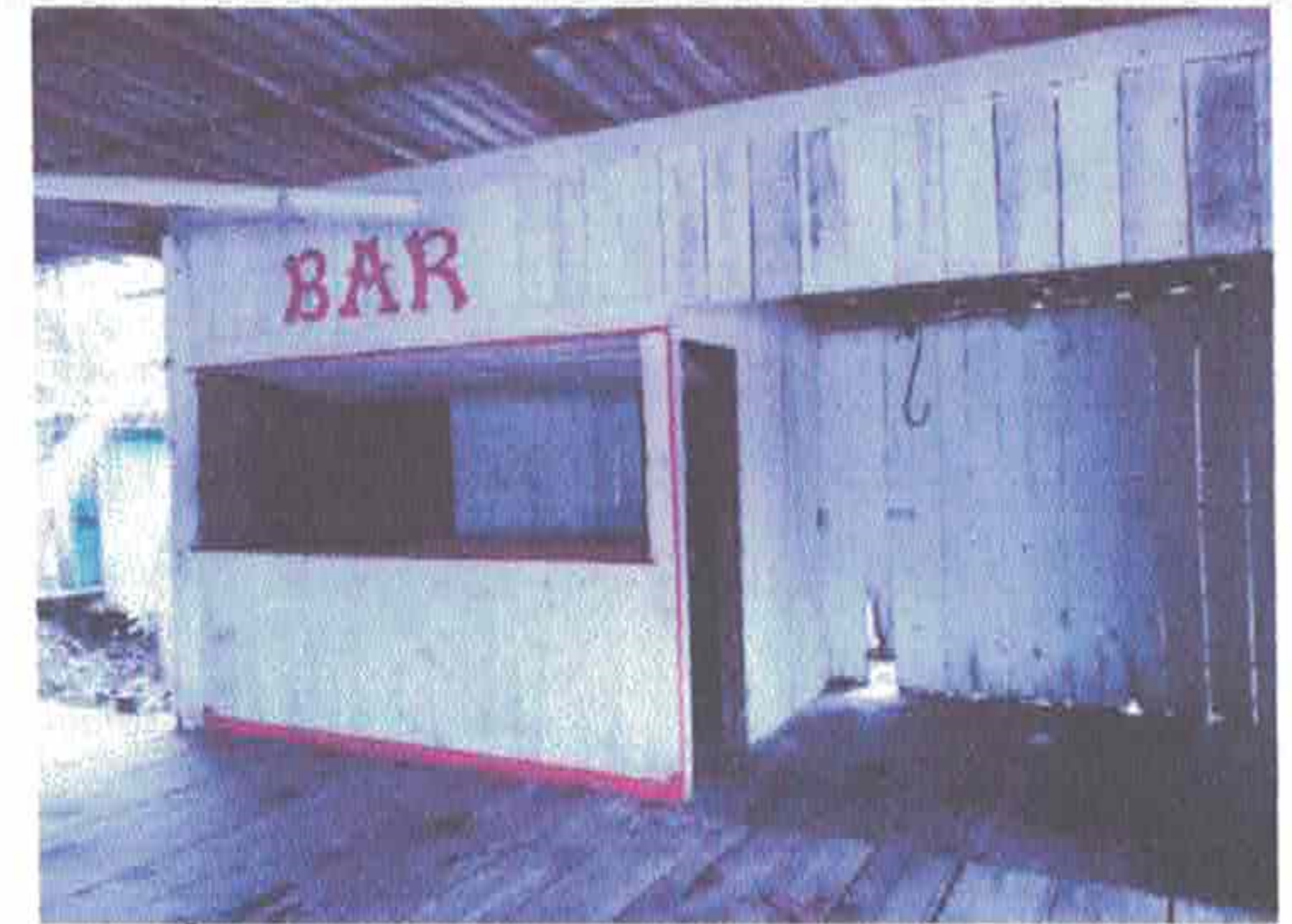
Imagem 6 – Área que pode servir como cozinha provisória