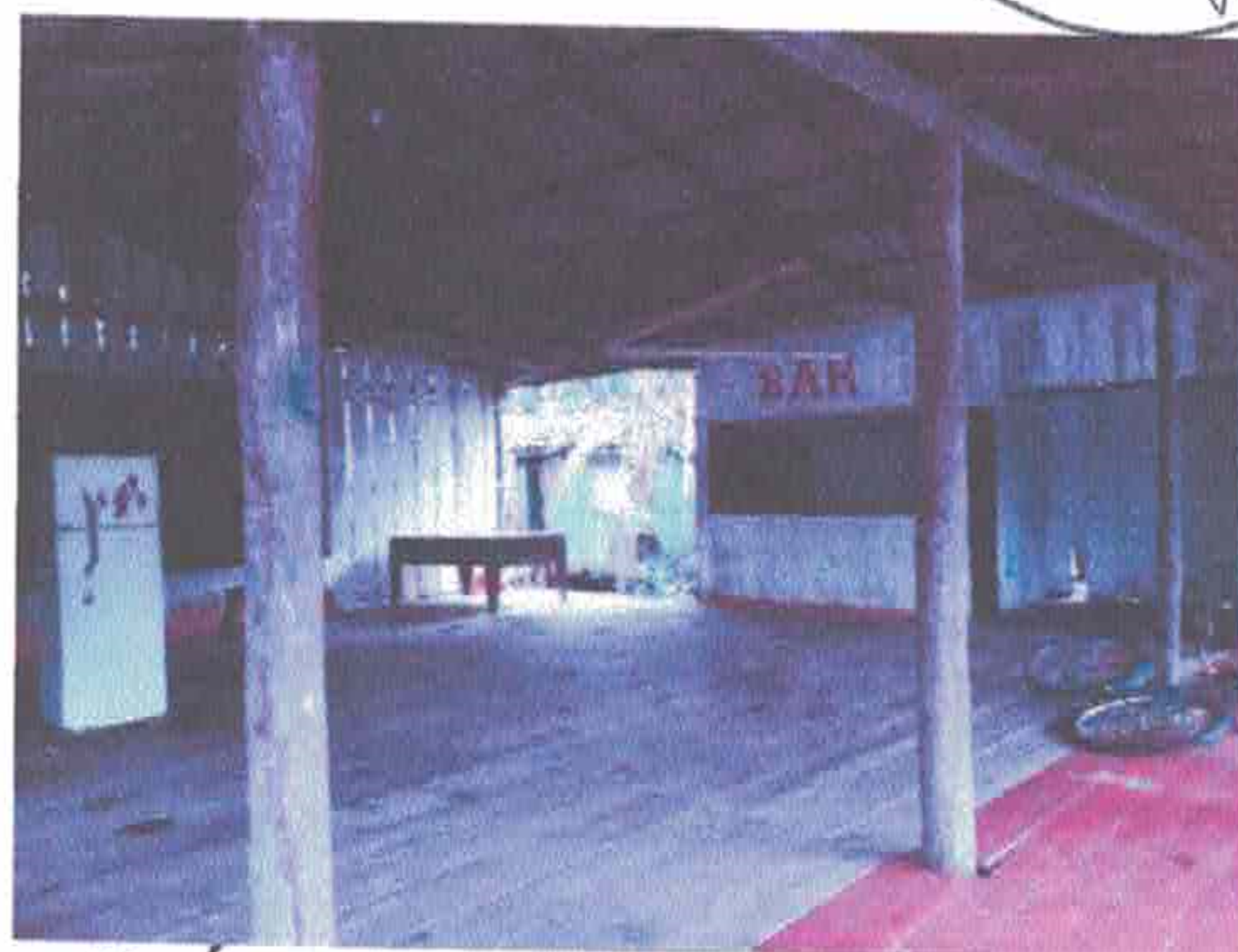
Imagem 10- Área do salão que pode ser dividida em sala