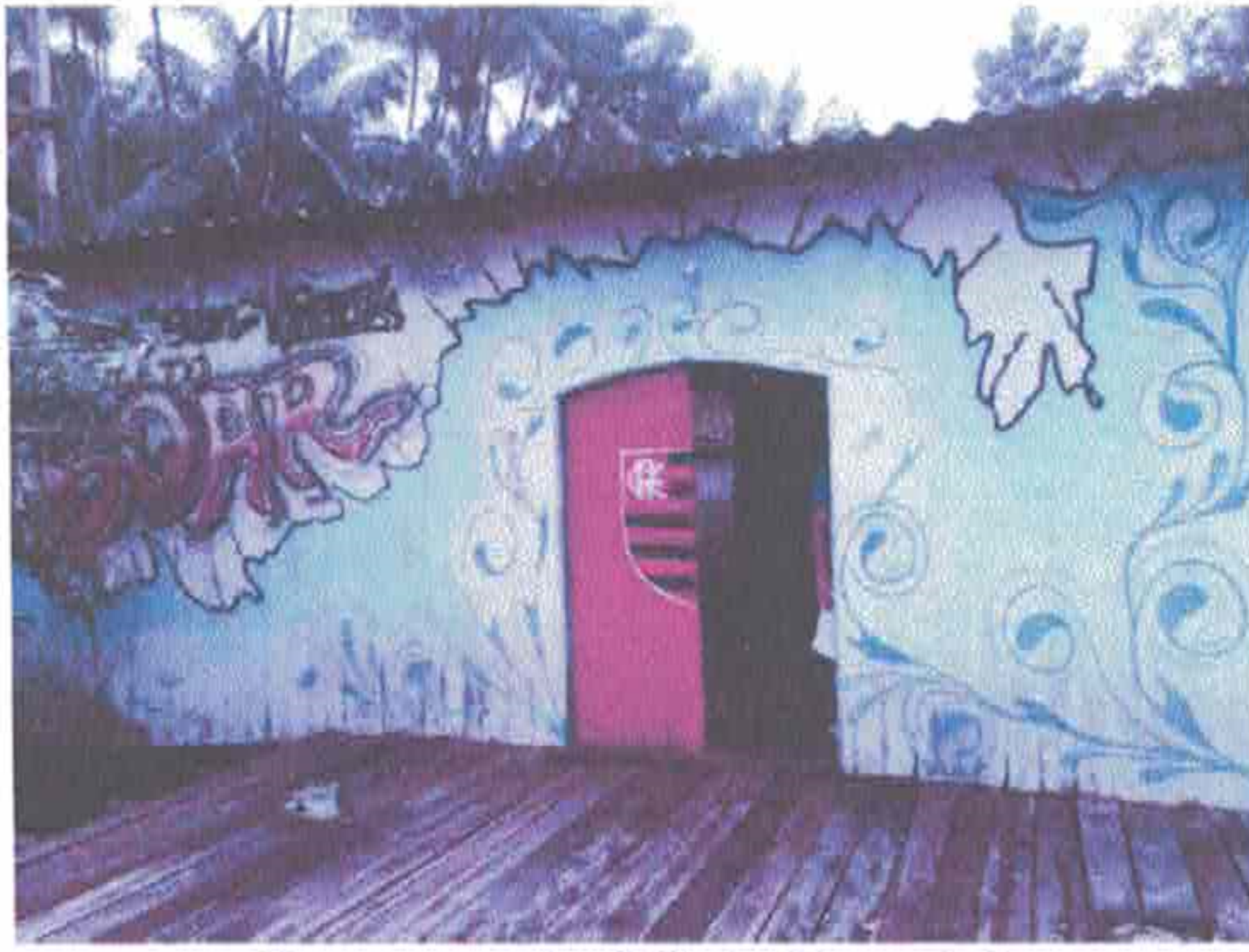
Imagem 1 - Vista Frontal