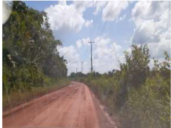
Imagem 03 – Ramal Cataiandeua