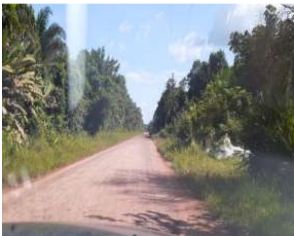
Imagem 08 – Ramal do Tauerá