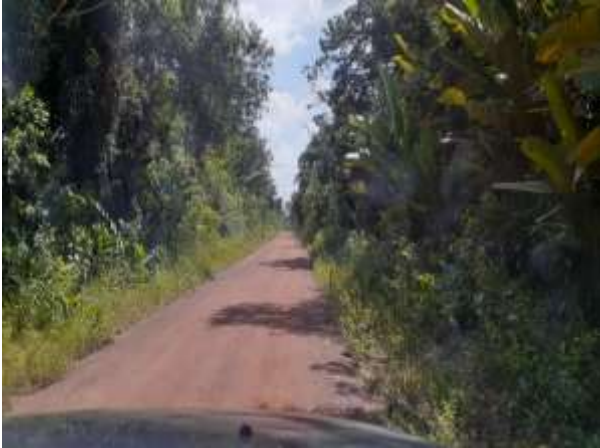
Imagem 01 – Ramal do Tucão