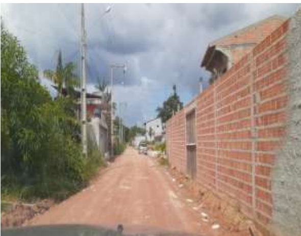
Imagem 06 – Ramal do Arienga