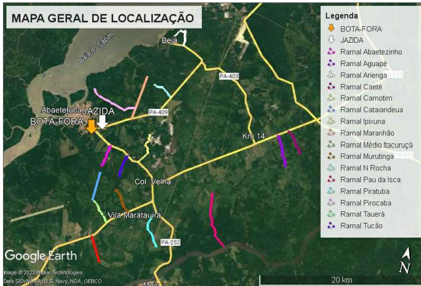
MAPA GERAL S/ Escala