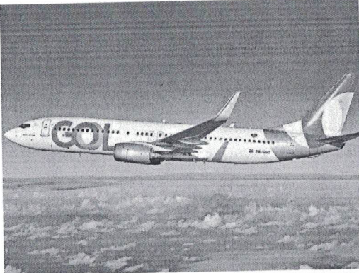
A Gol Linhas Aéreas entrou com pedido de Chapter 11 no Tribunal de Falências dos Estados Unidos

E acrescenta: "progressos notáveis até agora e acreditamos que este processo permitirá endereçar os desafios gerados pela pandemia".