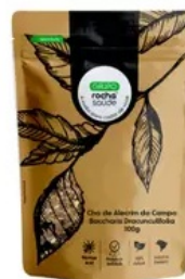
Cha de Alecrim do Campo - Baccharis Dracunculifolia - 100g