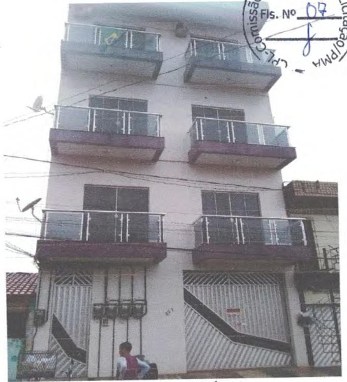
FACHADA DO PRÉDIO