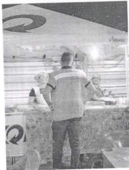
Foto 01: Orientação aos barraqueiros referente as fiações elétricas

Encerramos os trabalhos quando terminaram todas as apresentações às 00h40.