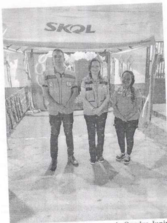
Foto 07- Os agentes que participaram da Quadra Junina 2022