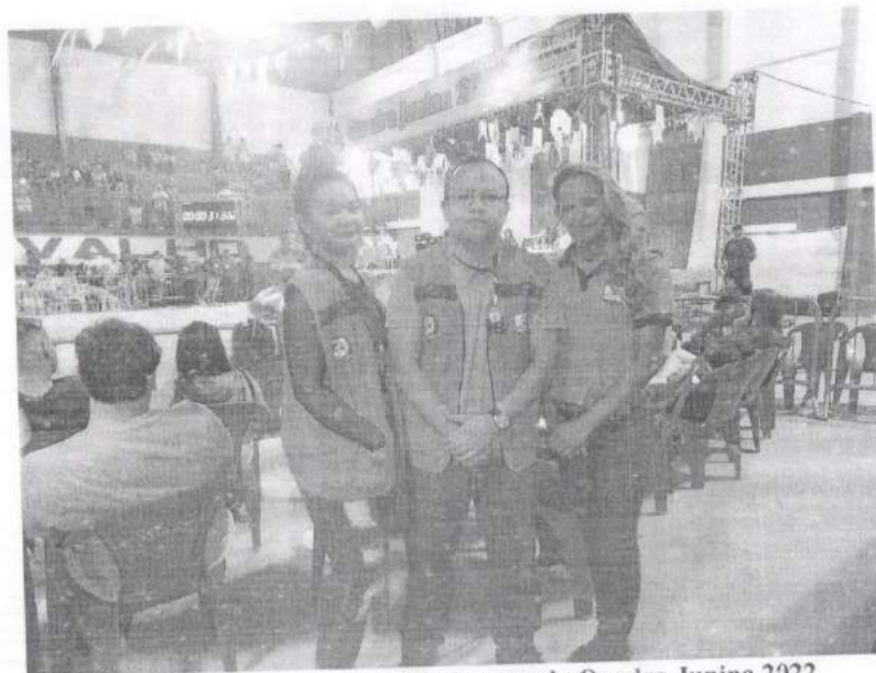
Foto 05- Os agentes que participaram da Quadra Junina 2022