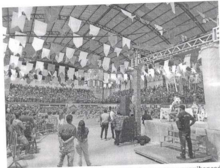
Foto 02: Orientação quanto a capacidade de pessoas na arquibancada