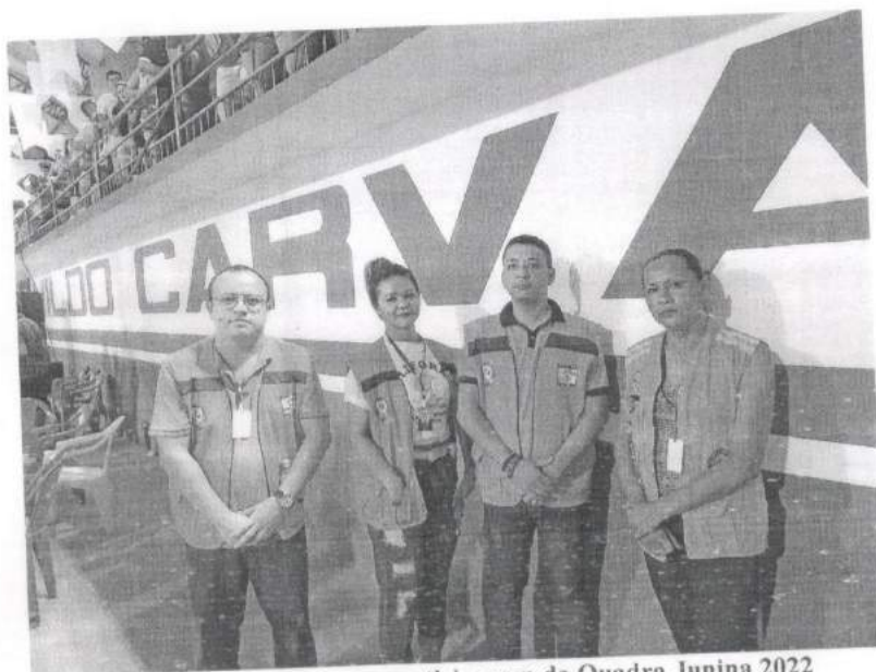
Foto 06- Os agentes que participaram da Quadra Junina 2022